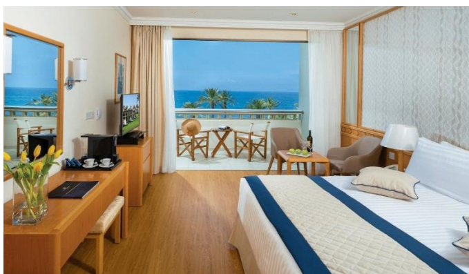
Constantinou Bros Athena Beach Hotel