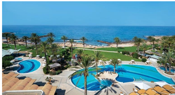
Constantinou Bros Athena Beach Hotel