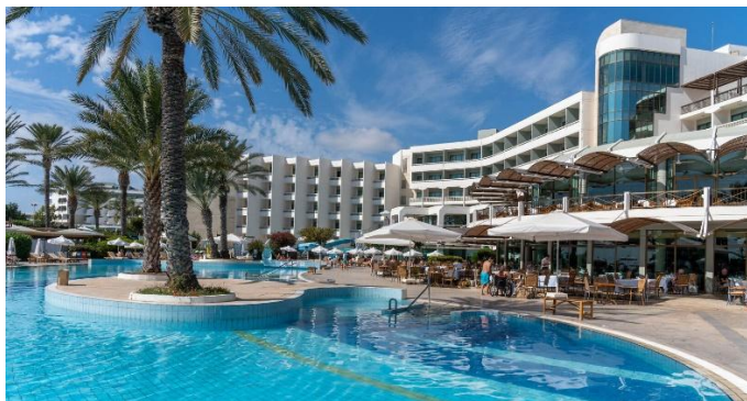
Constantinou Bros Athena Beach Hotel

Eine Bushaltestelle befindet sich direkt vor dem Hotel, und Taxis stehen jederzeit zur Verfügung.