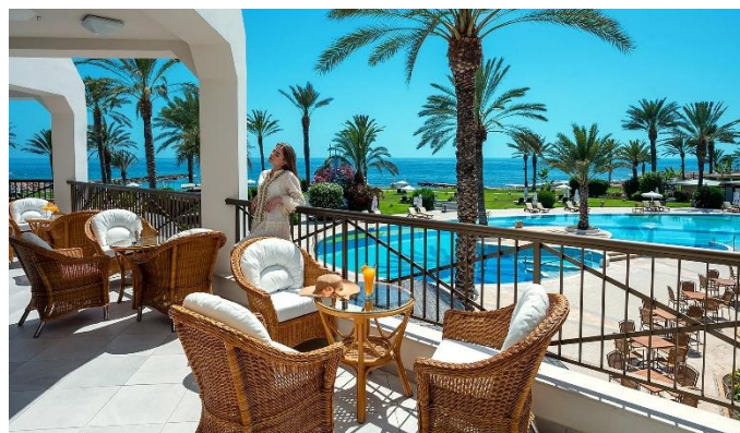
Constantinou Bros Athena Beach Hotel