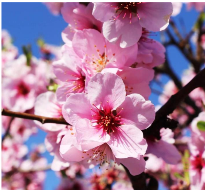
Blühender Mandelbaum auf Zypern

Bei Nichterreichen der Mindestteilnehmerzahl ist der Veranstalter berechtigt, den Kleingruppenzuschlag zu erheben. Der Kleingruppenzuschlag berechtigt nicht zum kostenlosen Rücktritt und gilt schon bei Buchung als Teil des Reisevertrags.